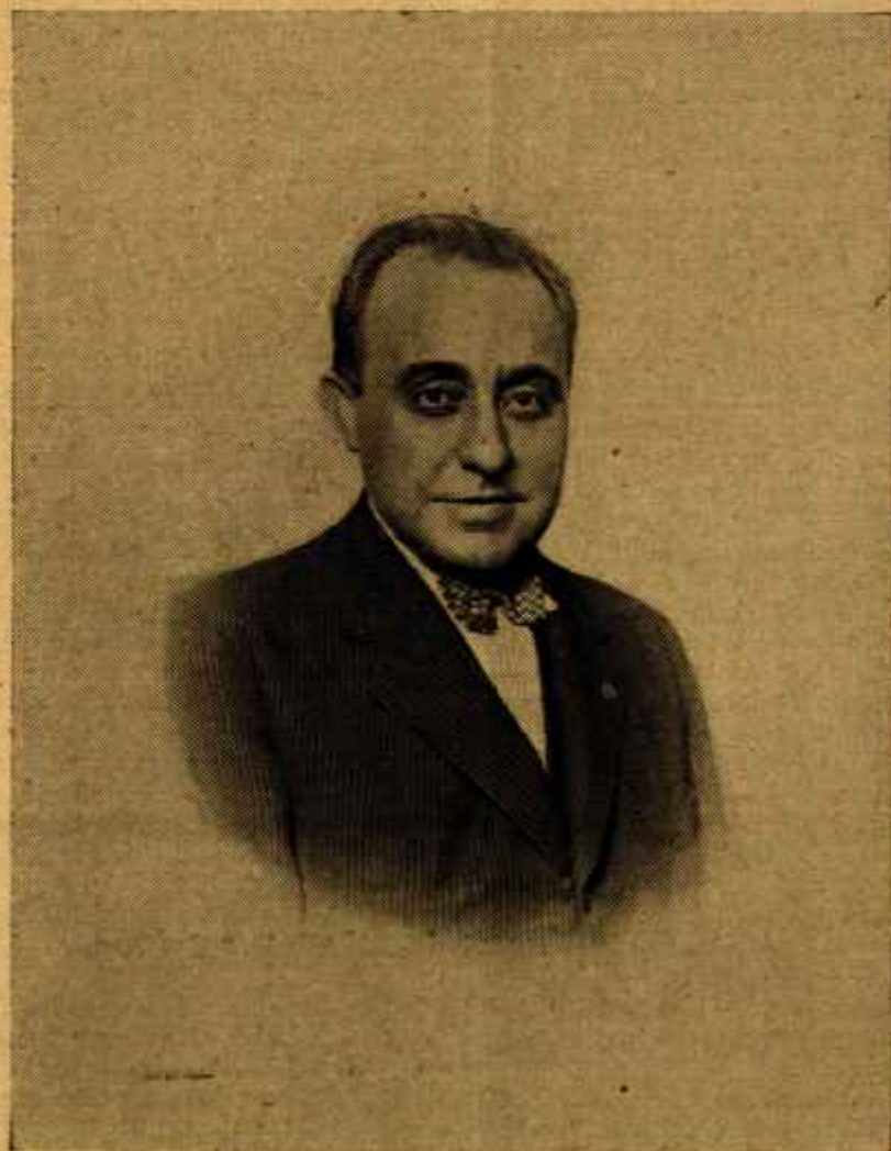
Excmo. Sr. D. Félix Gordón Ordás, Ministro de Industria y Comercio

Esta publicación consta de una Revista científica mensual y de este Boletín, que se publica todos los domingos, costando la suscripción anual a ambos periódicos 25 PÉSETAS, que deben abonarse por adelantado, empezando siempre a contarse las anualidades desde el mes de Enero.