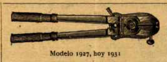
Modelo 1927, hoy 1931

Se mandain- mediatamente por ferrocarril arrebolsos por