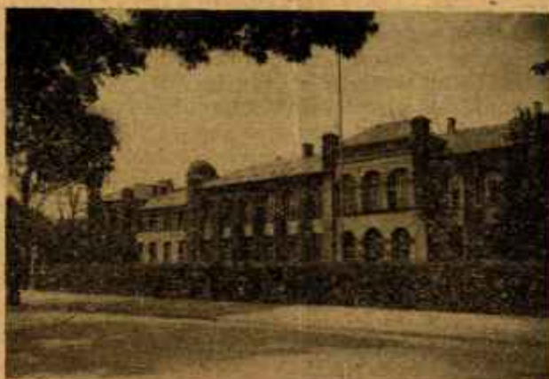
Edificio principal de la Escuela

los y resquicios, nidos de microbios. La Sala tiene, tanto los suelos como las paredes y el techo, contruidos para su fácil limpieza y desinfección. Una claraboya central, que comprende un tercio próximamente del área del último, proporciona abundante luz natural.