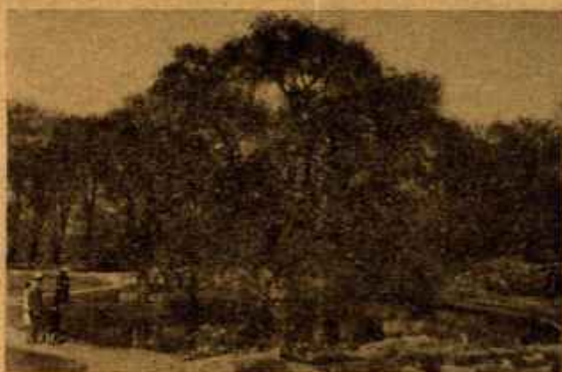
Un rincón del jardín de la Escuela

Son pocos los casos clínicos, pues es el tiempo de vacaciones—me dicen—