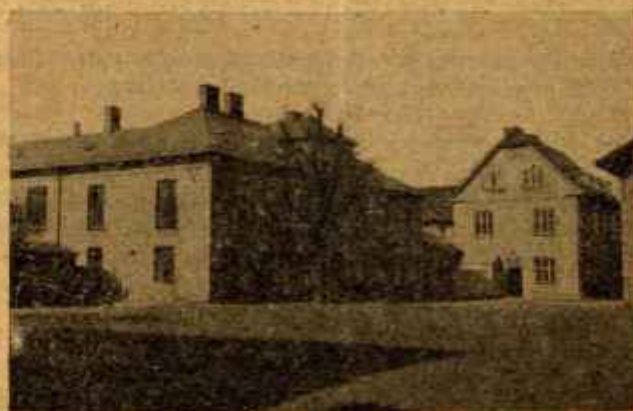
Pabellón de Fisiología

la agitación de unos u otros, o el mal genio. Y por otra parte, se ha realizado la intervención en el minimum de tiempo posible. Ya a todo esto, el caballo tan contento .