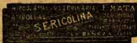
SERICOLINA PURGANTE DIFECTUOSO