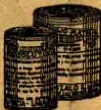
RESOLUTIVO ROJO MATA Poderoso resaca y resaca