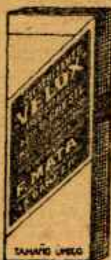
DIAGNOSTICO "VELOX" Hemorroides pedunculadas Cicatrización en 1 hora Resolución satisfactoria E.T.P. Farmacia: Barcelona - Lugo