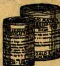
RESOLUTIVO ROJO MATA Poderoso reactivo y reactivo