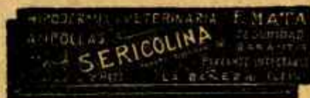
SERICOLINA PURGANTE INYECTABLE