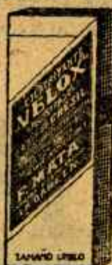
VELOX Hemostático poderoso Clarificante en agua Poderoso analgésico 1904 Mata, Baneza, León