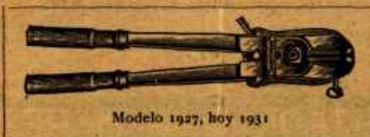
Modelo 1927, hoy 1931

Se mandan inmediatamente por ferrocarril reembolso por