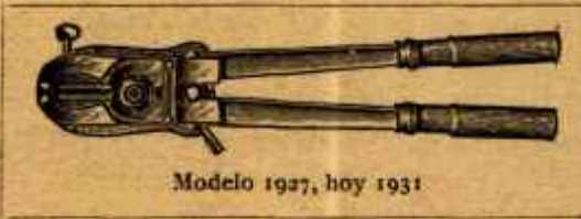
Modelo 1927, hoy 1931

Se mandan mediatamente por ferrocarril reembolso por