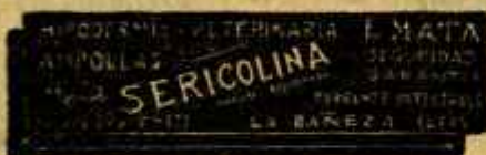
SERICOLINA PURGANTE INECTABLE