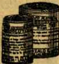
RESOLUTIVO ROJO MATA Medicamento resolutivo y modificado