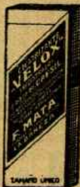
SEGURIZANTE "VELOX" Remedios potentes Clarificantes sin olor Resistentes a la oxidación SOL Farmacia: Barcelona - León