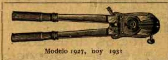
Modelo 1927, hoy 1931

Se mandan inmediatamente por ferrocarril a reembolso por