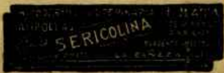
SERICOLINA PURGANTE EFECTIVO