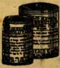
RESOLUTIVO ROJO MATA

Contra cólicos e indigestiones en todos los estados de gestación.