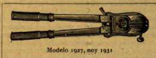
Modelo 1927, noy 1931

Se mandan inmediatamente por ferrocarril a reembolso por