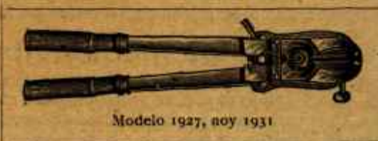
Modelo 1927, noy 1931

Se mandan inmediatamente por ferrocarril reembolso por