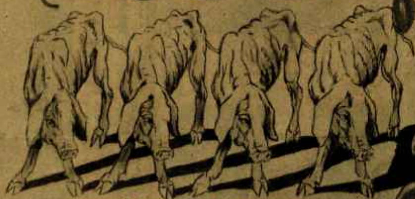
VICTIMAS DEL ABANDONO