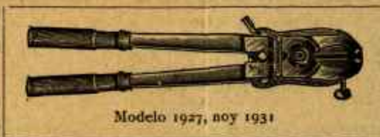
Modelo 1927, hoy 1931

Se mandan inmediatamente por ferrocarril a reembolso por