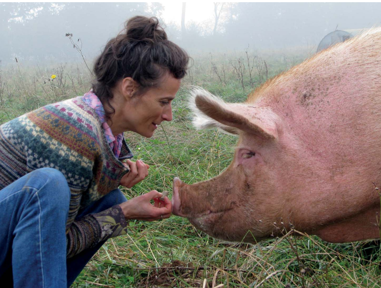
Imagen del documental

Contactar con gustavo@soberaniaalimentaria.info