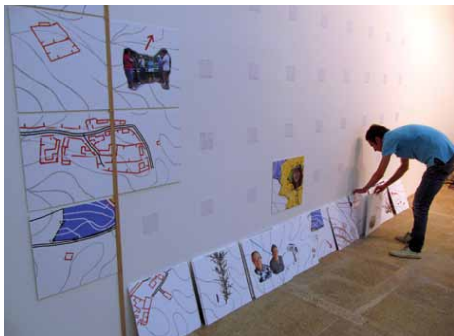
Montaje de la exposición “Xeografías do Mancomún”

Y evidentemente nostrxs también tenemos unos conocimientos situados, cada unx de nosotrxs, lxs impulsorxs de Montenoso, venimos con una mochila cargada de experiencias, pensamientos, certezas, incertidumbres y dudas que condicionan nuestra manera de ver el mundo. Así entre unxs y otrxs fuimos construyendo este proyecto común que tiene