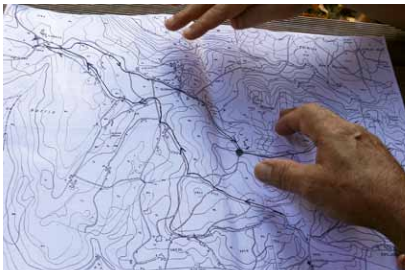
Trabajando la cartografía del común

abierto en el que almacenar información sobre los montes vecinales y en el que sobre todo poder generar conocimiento; por eso es un proyecto abierto a la participación que emplea también licencias creative commons en los dispositivos que promueve, lo que facilita el uso de los contenidos que se van generando, al contrario del