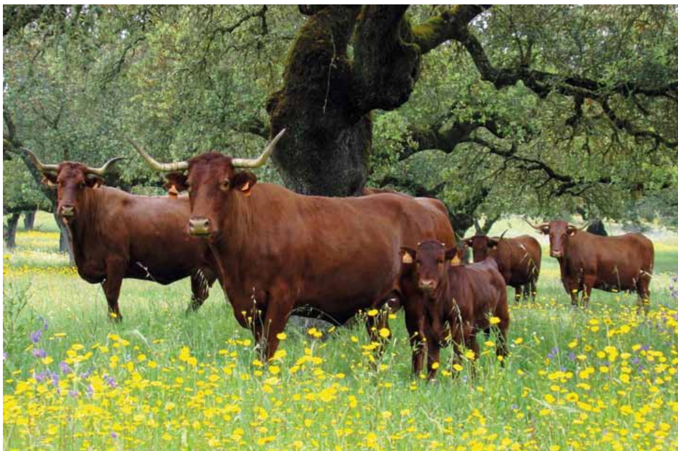
Vaca retinta en dehesa.

de ella. Y como contrapunto fundamental, transmitimos las voces y el día a día de quienes resisten manteniendo modelos de producción tradicionales respetuosos con los animales y con el entorno, en prácticas de ganadería extensiva que se explican con detalle.