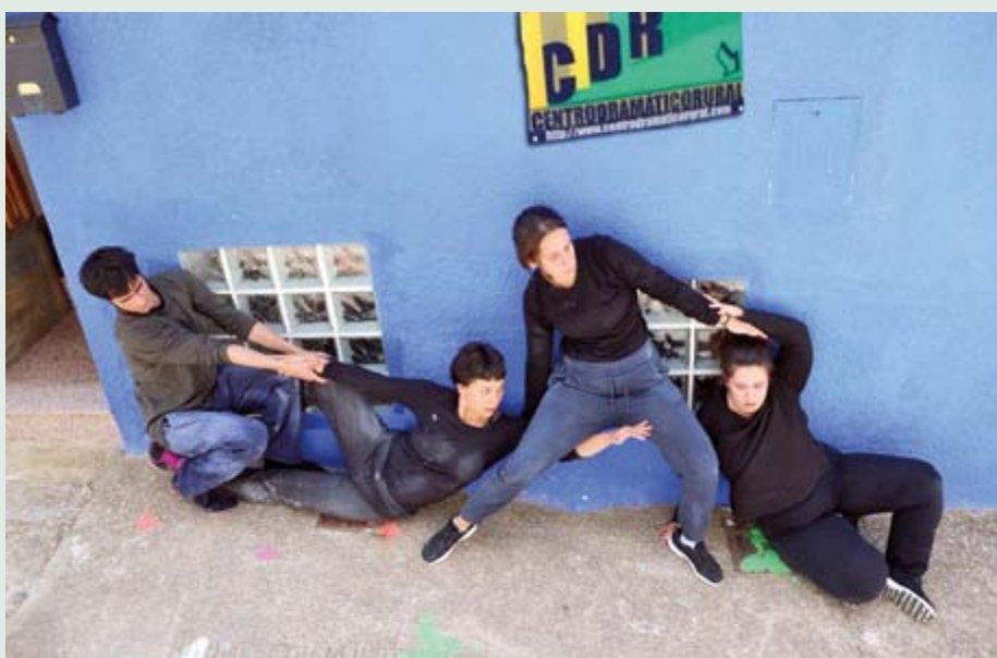
DanzaMira I en el Centro Dramático Rural de Mira.

Director del CDR-Centro Dramático Rural de Mira [Cuenca]