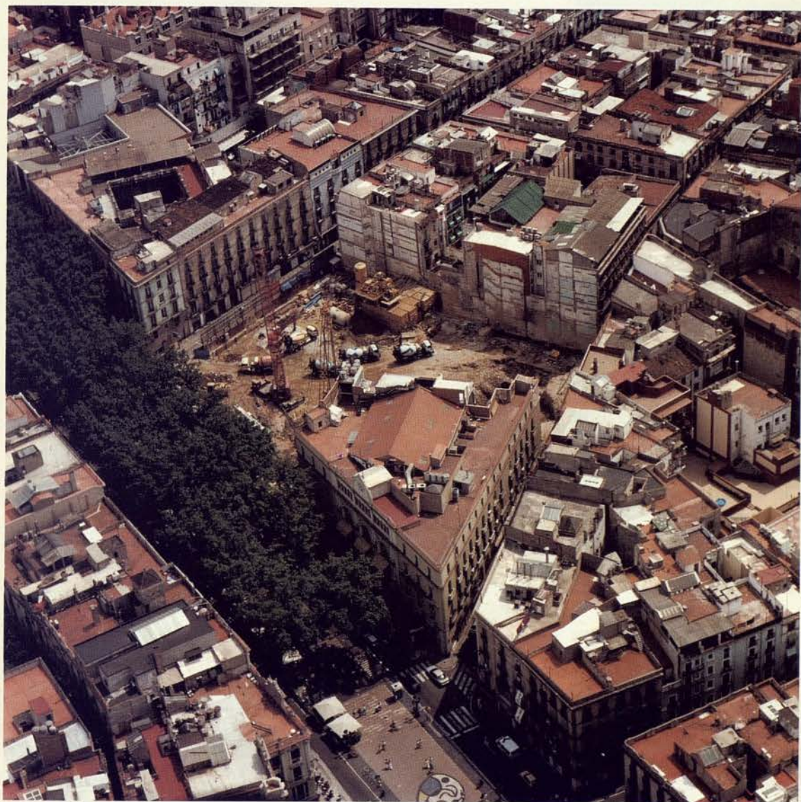
Projecte de reconstrucció i ampliació