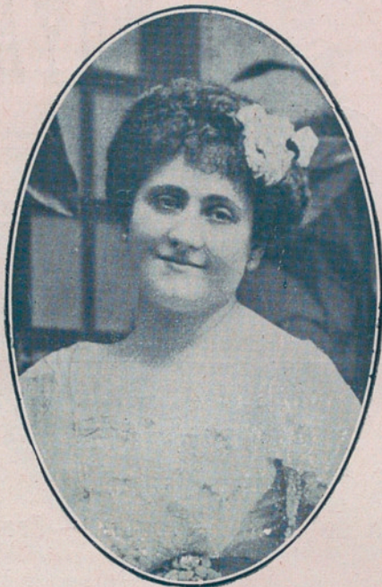
ELENA LUCCI, contralto