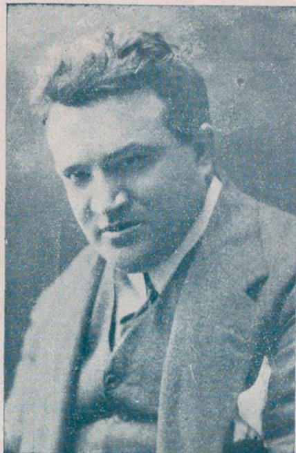
CESARE SPADONI, tenor