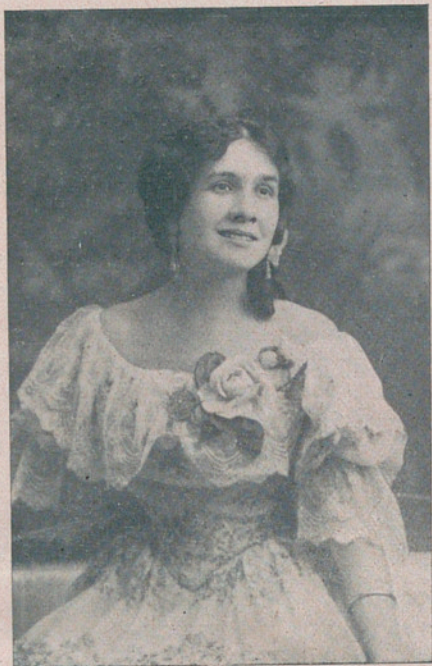
GRAZIELLA PARETO, eminente diva.