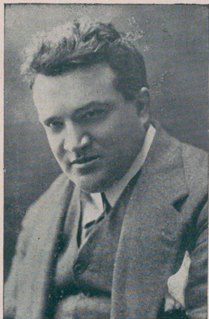
CESARE SPADONI, tenor