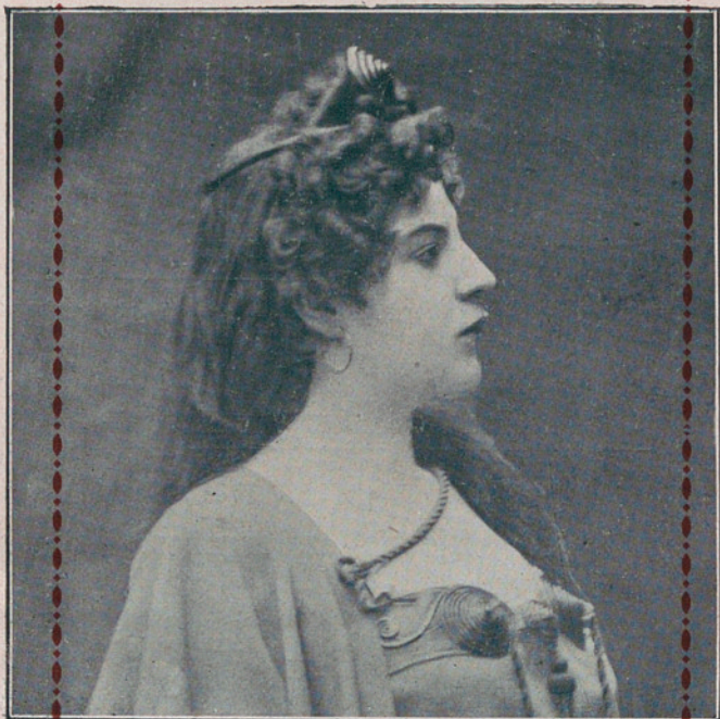
NINI FRASCANI, soprano .