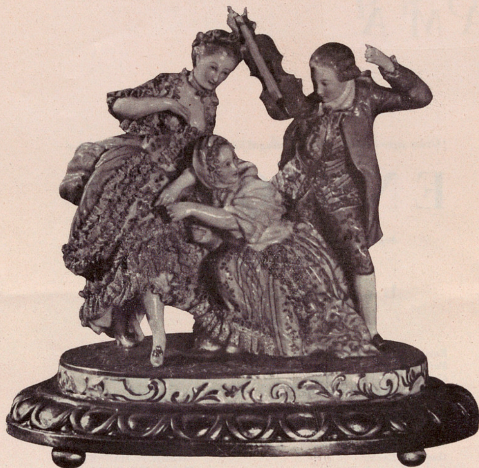
Grupo de porcelana Antigua Sajonia