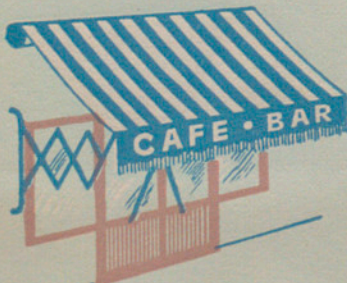
Fabricación de toldos para fachadas :: Toldos-encerados impermeabilizados para cubrir vagones de tren, camiones, carruajes, etc.

PRESUPUESTO JUNTA ADMINISTRATIVA DEL GRAN TEATRO DEL LICEO por un pasillo de lona para cubrir alfombra según el siguiente detalle: