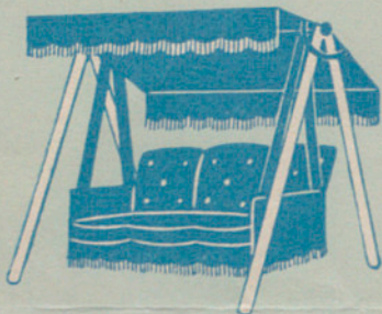
Columpios - mecedoras, tiendas de campaña, mochilas, bolsos