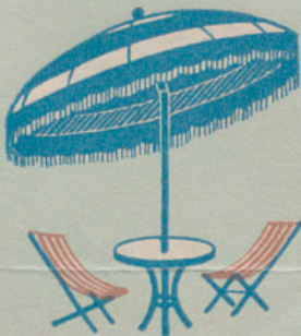
Parasoles, colchonetas y demás artículos para campo y playa, tapizados en lona