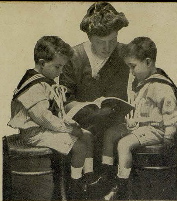
La princesa Pilar con sus sobrinos los infantes Luis Alfonso y José Eugenio.