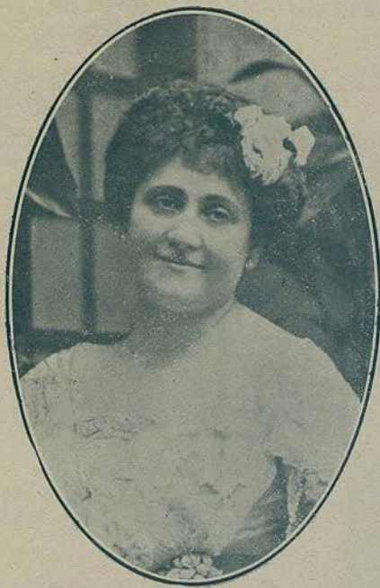
ELENA LUCCI, contralto