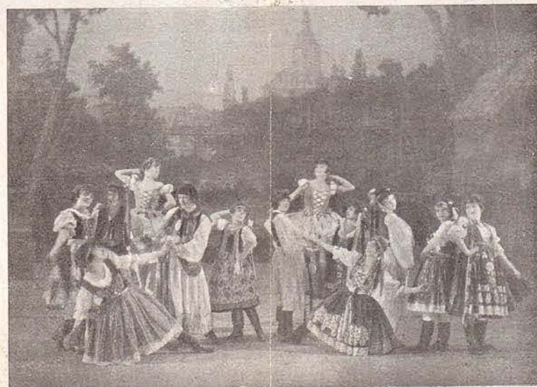
Cuerpo de baile ruso