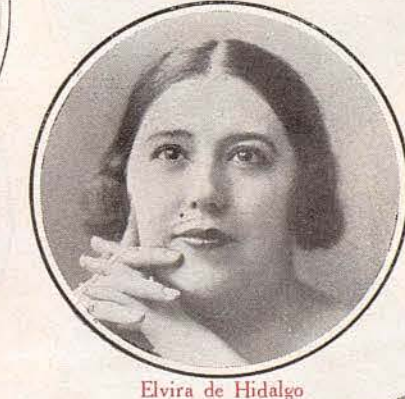
Elvira de Hidalgo