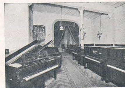
Sala Exposición y Ventas de la Sucursal, Buensuceso, 5