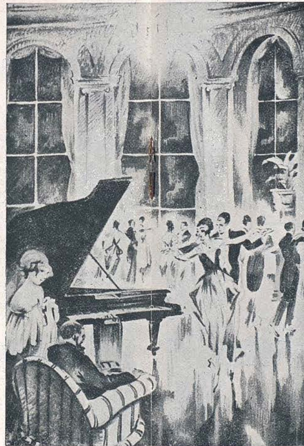
UN TRI-PHONOLA DISPUESTO PARA UN BAILE