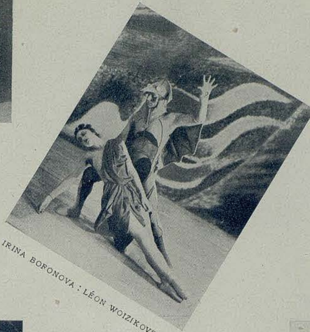
IRINA BORONOVA : LÉON WOIZKOVSKY