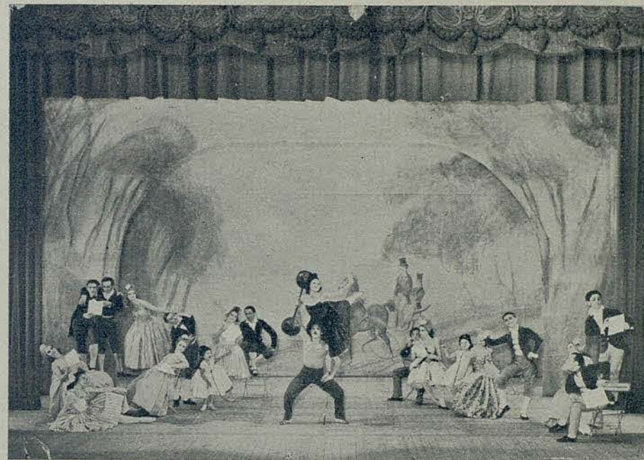
EL BELL DANUBI BLAU