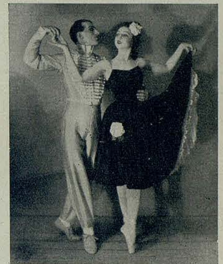
LÉONIDE MASSINE : ALEXANDRA DANILOVA