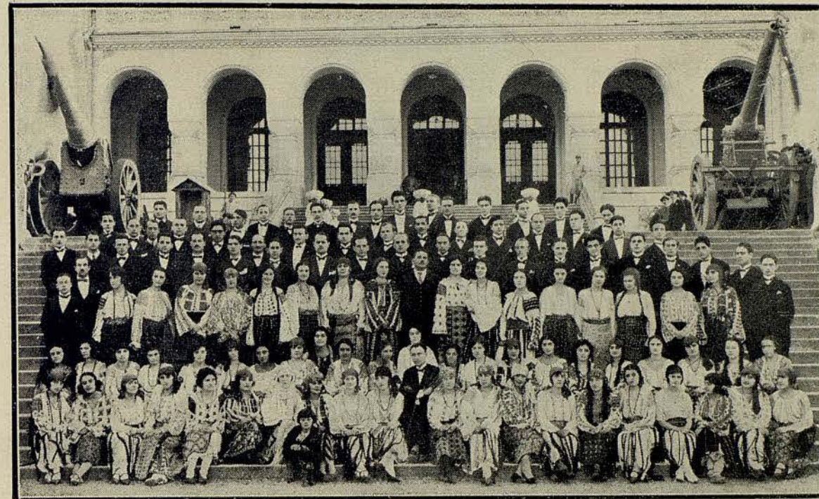
Les membres du choeur de la „Cântarea României“ avant leur départ pour Prague en 1924.