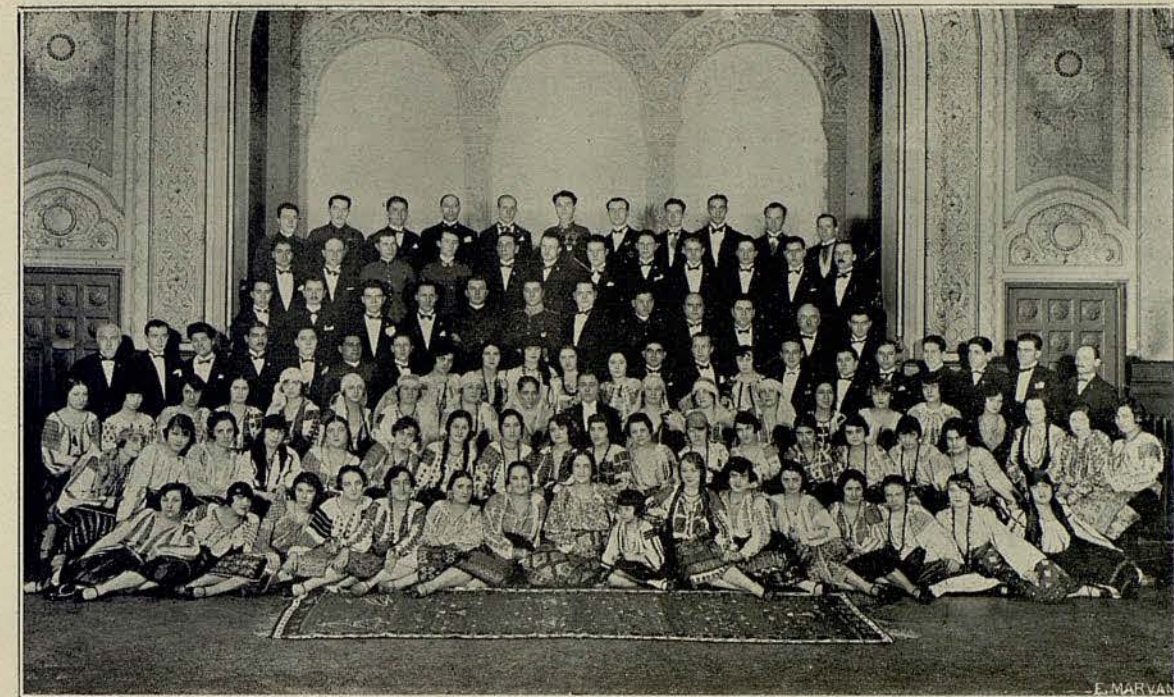
Les exécutants membres du chœur, qui ont chanté en Italie en 1927.

Plus de cent exécutants vocaux, venus chez nous de Roumanie, nous ont montré