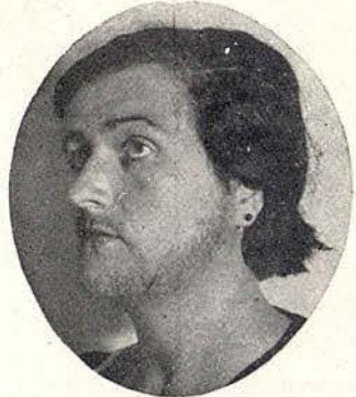
Antes del tratamiento