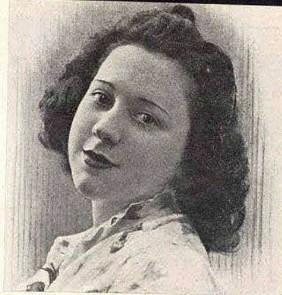
ALICIA DE LARROCHA

Talleres Gráficos IRANDEZ Valencia, 214 Teléfono 71872 BARCELONA