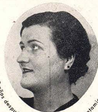
2 años después de haber terminado el tratamiento

Señora, Señorita: Su mayor enemigo es el vello. El es la causa de su tristeza y preocupación: si no fuera por el VELLO que amarga su existencia, sería usted completamente feliz. Tenga LA SEGURIDAD que curará de él, acudiendo a la consulta de