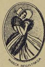
El vestido es un modelo de «La Física»