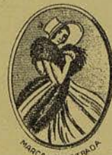
El vestido es un modelo de «La Física»