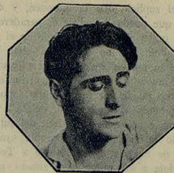
Gr. Uff. G. Lauri Volpi

Scarpia ve en ello el medio de apoderarse de Angelotti y ordena a sus secuaces sigan a Tosca.