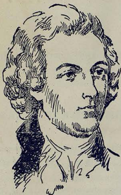
A. W. MOZART