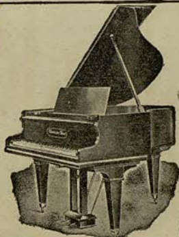
114 de COLA (mod SAPO)