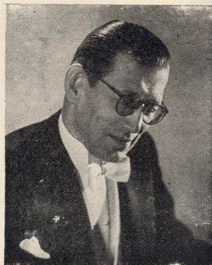
Col. W. de BASIL

Tiene en su repertorio más de 200 ballets creados por los más insignes coreógrafos, como BALANCHINE, FOKINE, LICHINE, LIFAR, MIASSINE, NIJINSKA y otros, que la Compañía ha estrenado ante los públicos más exigentes con éxito inenarrable y en los más distintos países del mundo. Los fastuosos decorados originales de los grandes pintores, ejecutados y realizados exclusivamente para los Ballets de la Compañía del Coronel de BASIL , se guardan cuidadosamente, y son todavía los que se