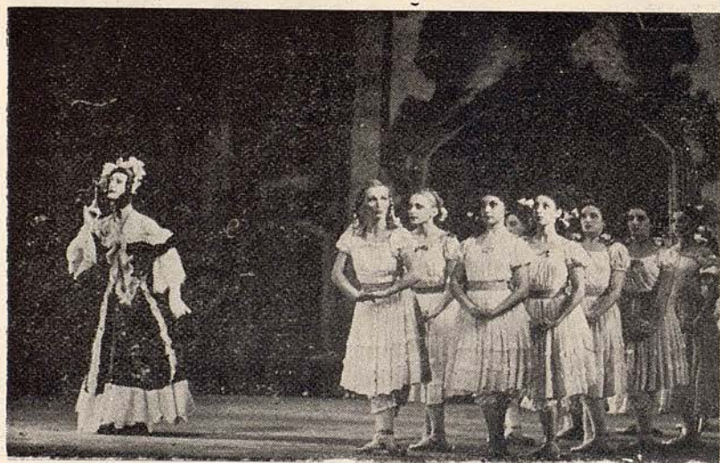
Una escena de "BAILE DE LOS CADETES"