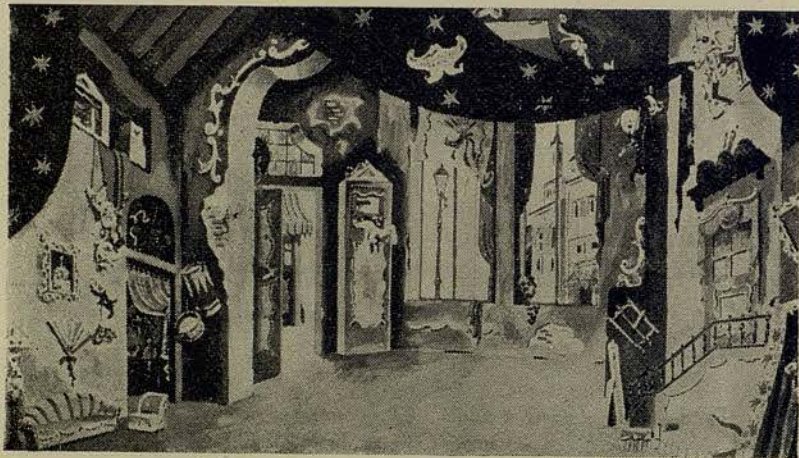
Boceto para el decorado de "La boutique fantasque"