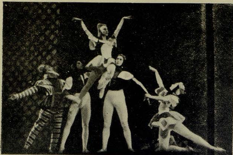
Una escena de "Juego de naipes"