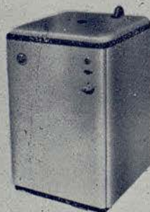
DE LUXE B 100 4.550 Ptas.