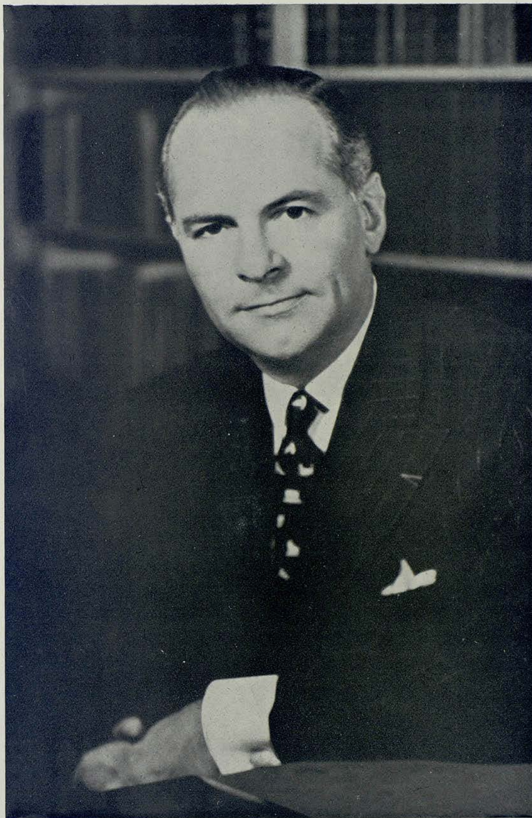
HON. JOHN DAVIS LODGE