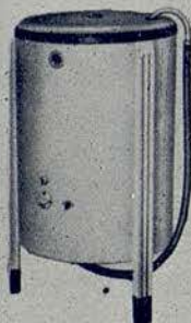
CONFORT A 200 4.280 Ptas.