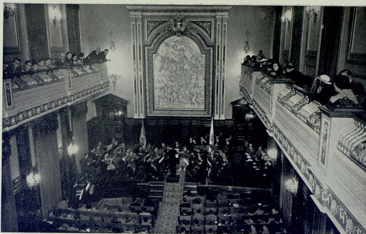
La Orquesta del Conservatorio Superior del Liceo en una de sus audiciones