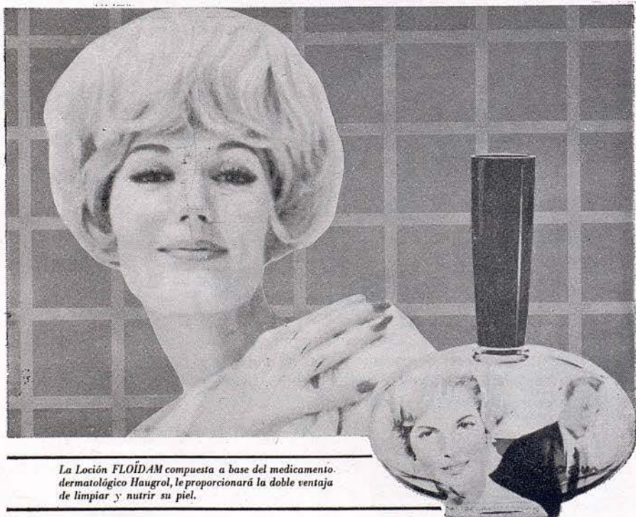
La Loción FLOIDAM compuesta a base del medicamento dermatológico Haugrol, le proporcionará la doble ventaja de limpiar y nutrir su piel.

La acción benéfica de la Loción FLOIDAM, aplicada noche y día al cutis, proporciona a la epidermis el frescor de una eterna juventud, porque al limpiarlo en profundidad lo hidrata y nutre, eliminando totalmente los barros y grietas.