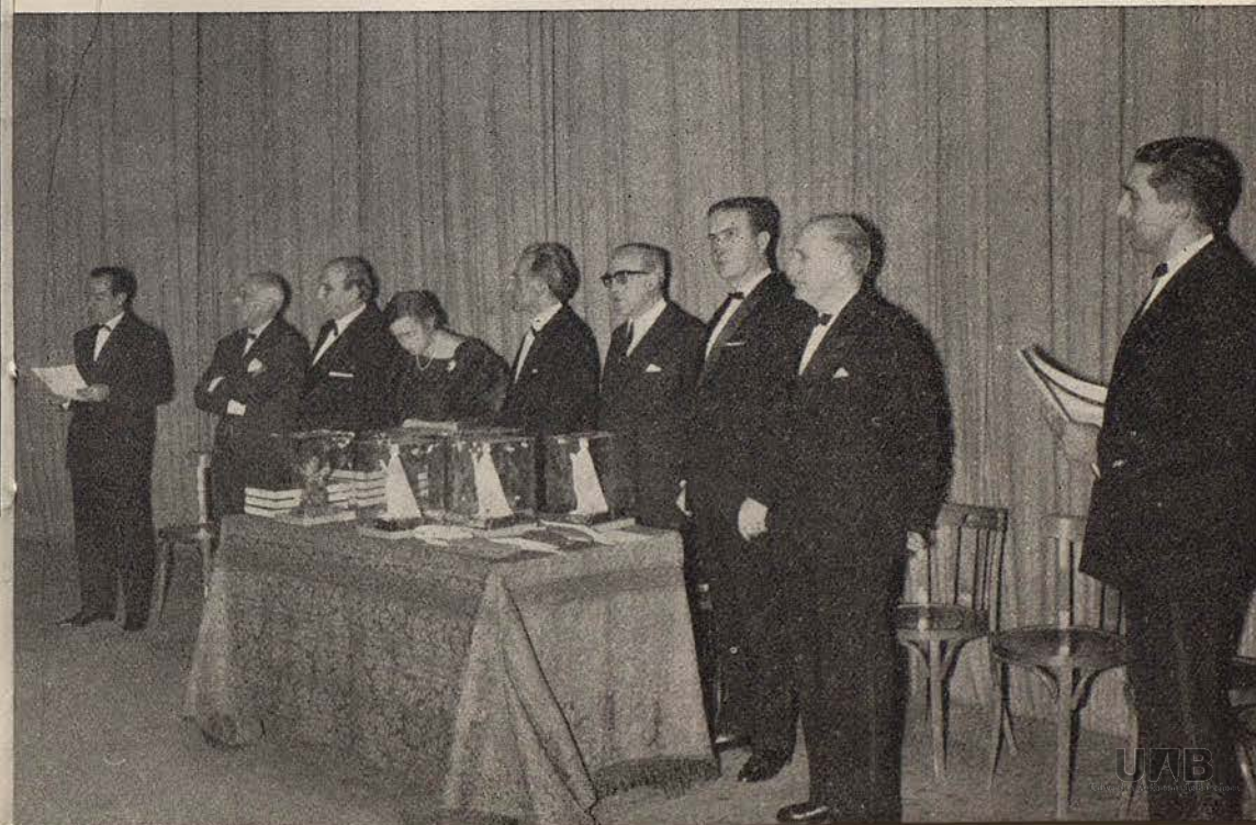
Lectura del Acta del fallo del Jurado en el Gran Teatro del Liceo.