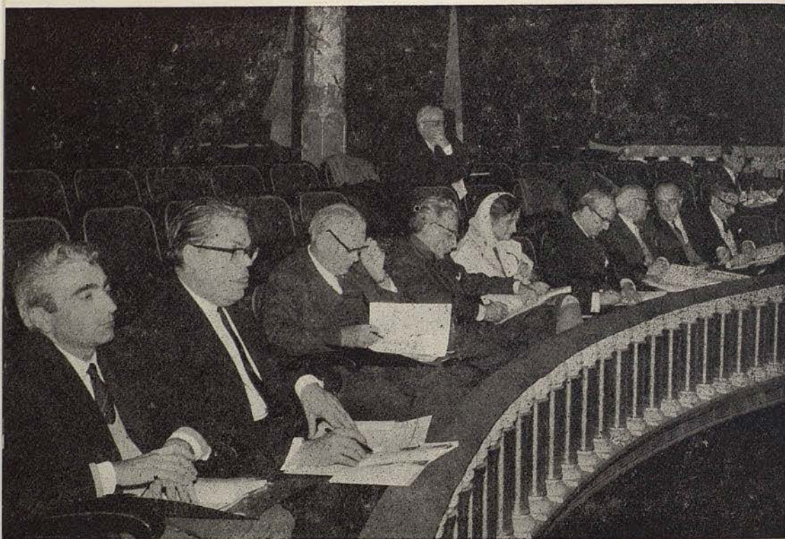
El Jurado Calificador del III Concurso «Francisco Viñas», durante la eliminatoria final en el Palacio de la Música.