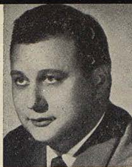
47. OSLAVIO DI CREDICO tenor (Italia)