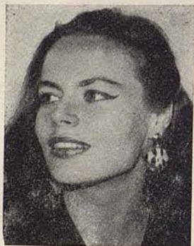
46. HARRIET STUBBE contralto (Alemania)