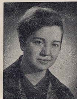
32. CLOTILDE MIRO soprano (España) Grupo B