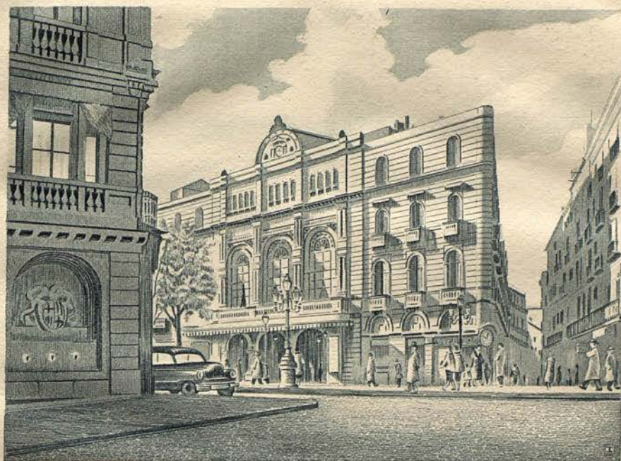
GRAN TEATRO DEL LICEO, BARCELONA