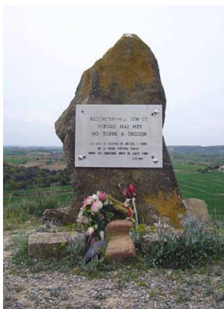
Figura 6. Monòlit commemoratiu de l'Agrupació de Supervivents de la Lleva del Biberó al capdamunt del Merengue, 1985.

B.3 Cal recuperar la memòria històrica? L'any 1985 l'Agrupació de Supervivents de la Lleva del Biberó va alçar un monòlit commemoratiu al capdamunt del Merengue on hi ha escrit: «Recordem-ho sempre perquè mai més torni a succeir». Això permet plantejar a l'alumnat la reflexió sobre si cal i per què recuperar la memòria de la Guerra Civil (Figura 6).