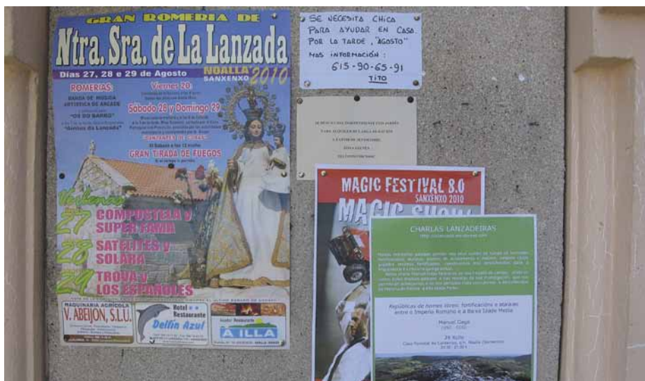
Figura 13. Cartel de charla lanzadeira en un punto de información parroquial (tablón en supermercado) compitiendo con otras ofertas de ocio y trabajo.