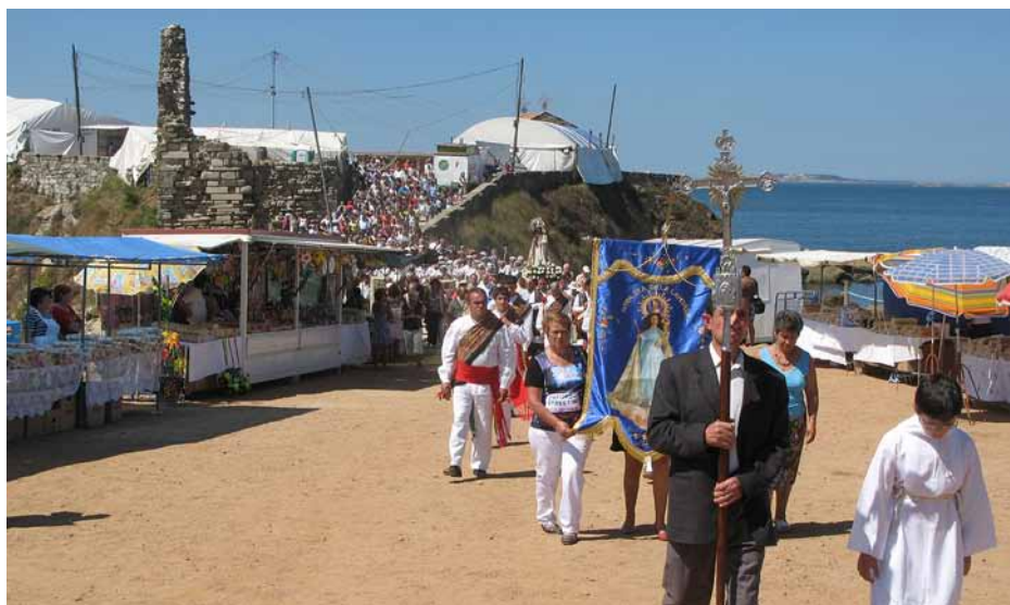
Figura 14. Detalle de la Romaría da Nosa Señora da Lanzada (agosto de 2010). Procesión religiosa en el yacimiento arqueológico.