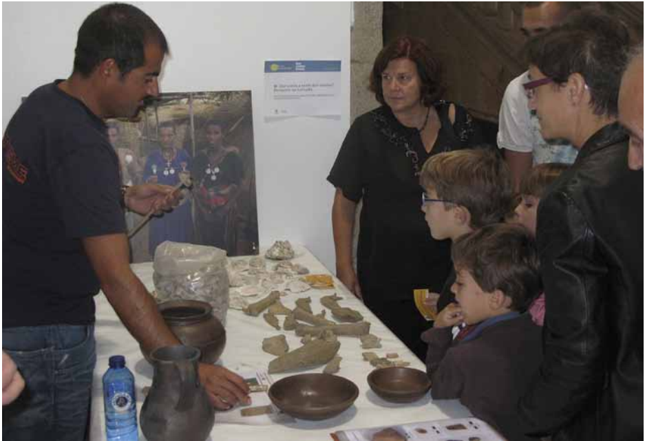
Figura 11. Stand de A Lanzada en la Noite d@s Investigador@s (septiembre de 2010).