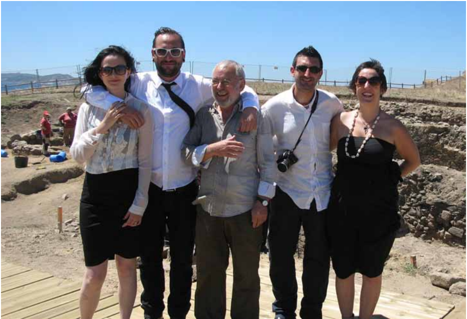
Figura 7. Fotos de boda en la excavación de A Lanzada. El padre del novio excavó en los años sesenta en el yacimiento como alumno colaborador del Museo de Pontevedra.