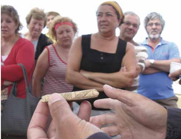
Figura 6. Visita guiada a las excavaciones de A Lanzada: Asociación vecinal Neixón de Cespón (Boiro, A Coruña).