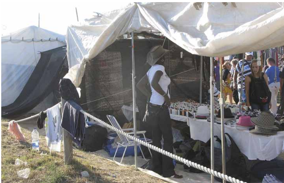
Figura 16. Globalización, multiculturalidad, inmigración, y patrimonio en el área arqueológica de A Lanzada; un cartel promocional del proyecto ( Descubre A Lanzada ) es reutilizado como elemento separador de un tenderete regentado por senegalesas y otro atendido por bolivianas en la Romaría de A Lanzada (agosto de 2010).