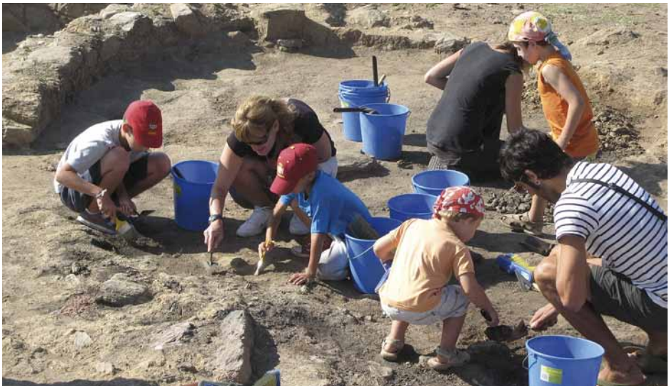
Figura 10. Familia excavando en A Lanzada.