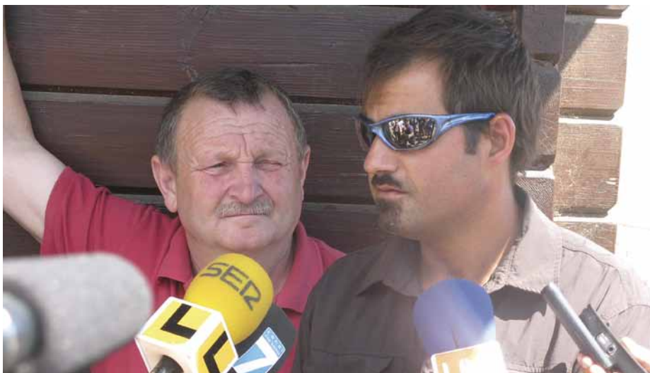
Figura 15. El presidente de los Comuneros de Noalla y el director de la excavación arqueológica de A Lanzada atendiendo a los medios en el yacimiento.