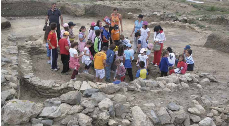
Figura 9. Escolares del colegio público de Noalla en la excavación de A Lanzada.