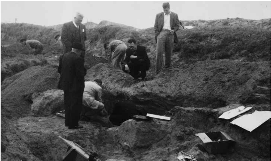
Figura 2. Arqueólogos supervisando el trabajo de excavación en A Lanzada en los años cincuenta.