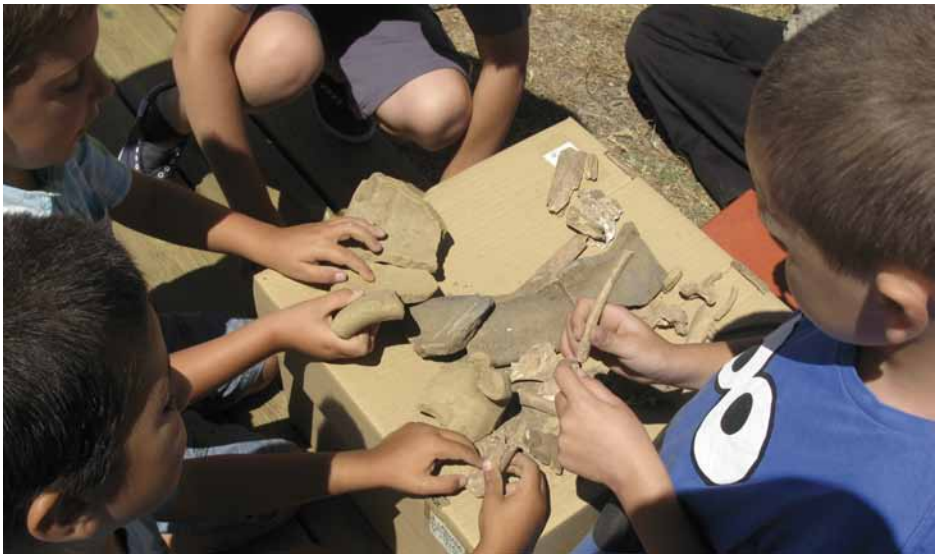
Figura 12. Experimentando con la cultura material.