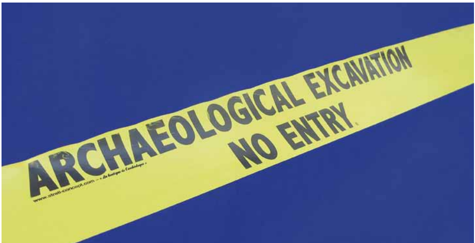
Figura 4. ¿La profesionalización de la arqueología conlleva la exclusión social?