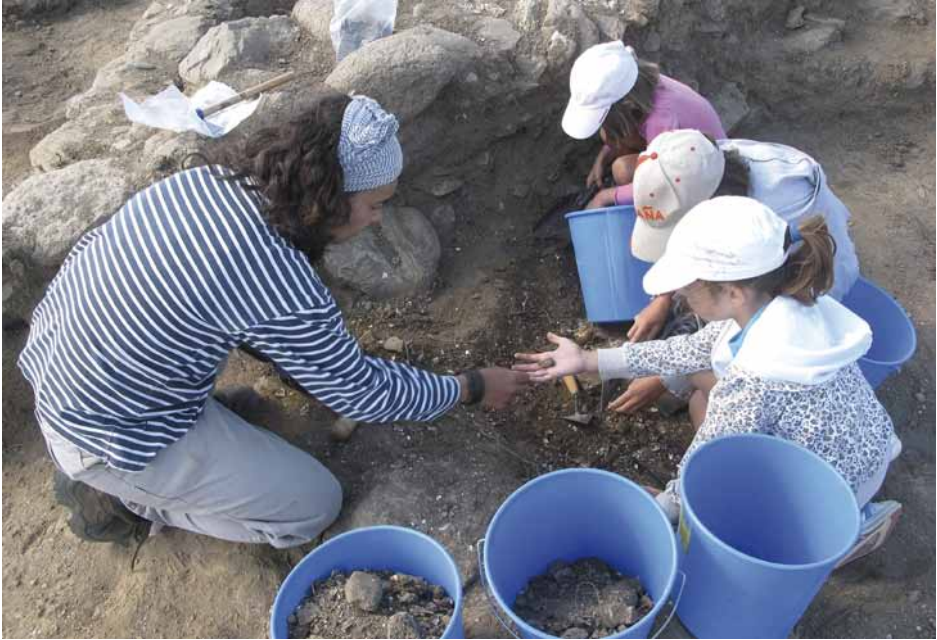
Figura 5. Una alternativa a las vacaciones Santillana: niñas-turistas participando en nuestras excavaciones en A Lanzada (agosto de 2010).