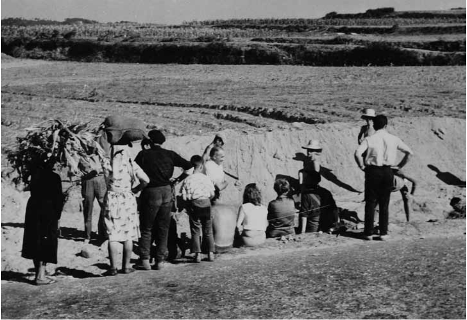
Figura 3. La comunidad local como mera espectadora de una arqueología clasista y (casi) colonial.