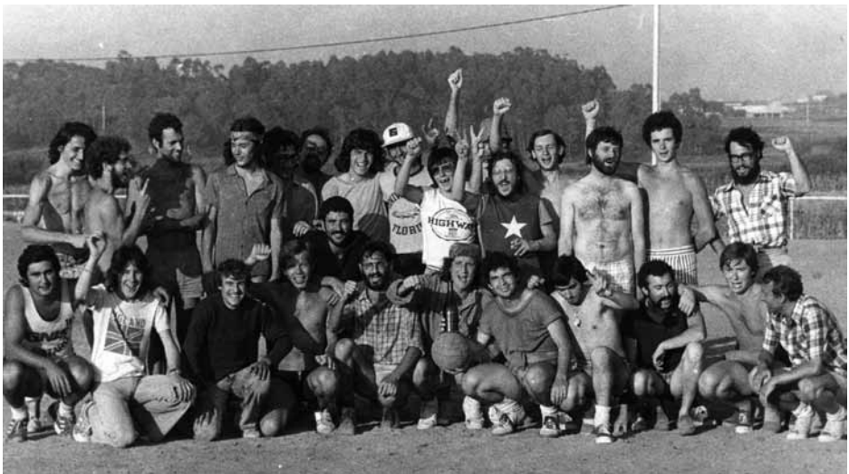
Figura 8. Los tiempos cambian. Arqueología hippie en A Lanzada en los años de la transición democrática.