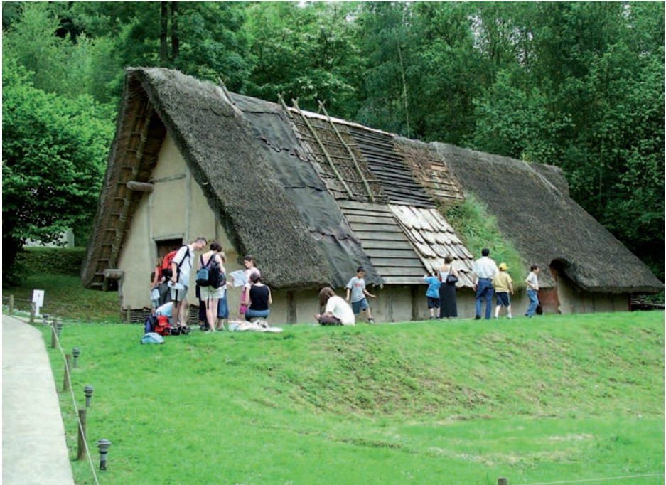
Figure 4. La reconstitution de la « maison 3 » du village Néolithique ancien de Darion (7.000 ans, province de Liège, Belgique) montre simultanément plusieurs hypothèses de construction. Les visiteurs perçoivent la reconstitution comme un objet de synthèse d'hypothèses et non comme une réalité préhistorique.

Le Musée-Médiateur se doit d'expliquer son processus de patrimonialisation et de recherche de manière à rendre compréhensible pour tout un chacun le « point de vue » qui détermine tous ses choix et ses actions. Le making off est une des bases déontologiques (Collin, 2001-2002) (figure 4)