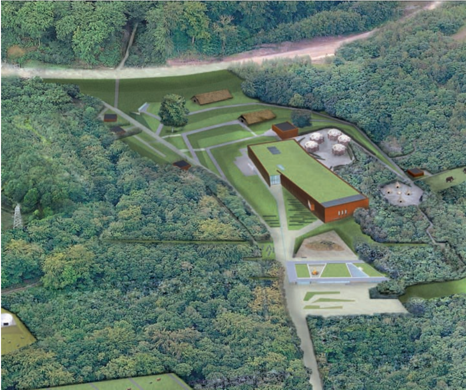
Figure 2. Vue d'ensemble du projet d'agrandissement. Le Préhistosite de Ramioul devient le Préhistomuseum.

Wallonie est reconnu comme Musée de catégorie A par la Fédération Wallonie-Bruxelles qui a en charge le ministère de la culture.