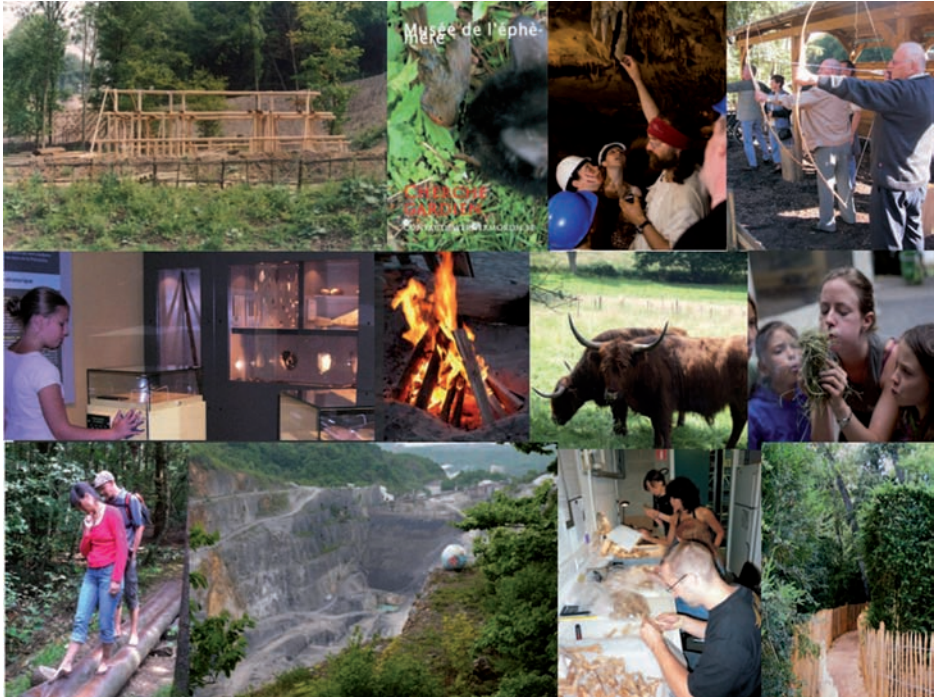
Figure 5. Patchwork visuel des trois thèmes et des deux manières de voyager qu'offrira le futur musée. Le Préhistosite entend bien se reformuler sans renier ce qui a fait sa typicité pendant près de vingt ans.

gigantesque bond dans le temps, à l'époque des dinosaures où l'homme n'existait pas. C'est l'occasion de comprendre comment s'est formé le calcaire, puis la grotte et de découvrir enfin le site archéologique.