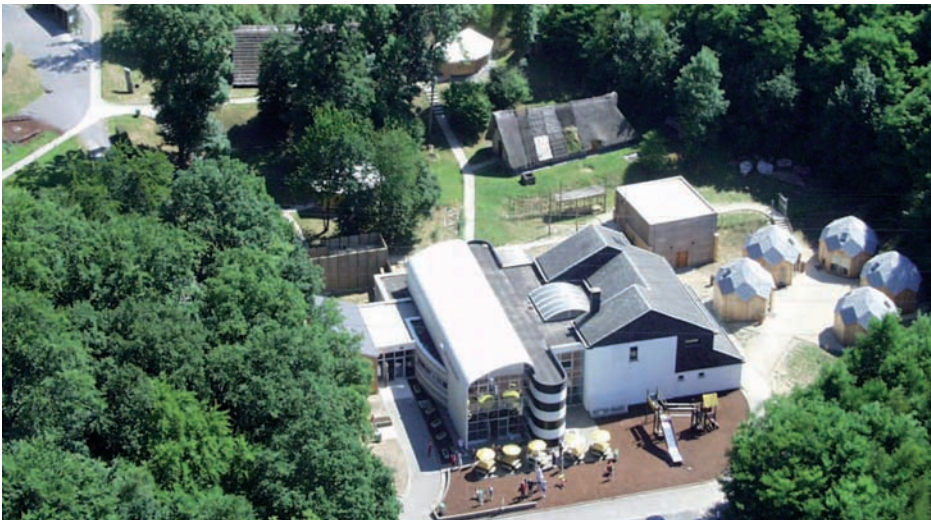
Figure 1. Vue aérienne du Préhistosite à la veille des travaux.

bien le concept de découverte active dont il veut se doter: «j'entends, j'oublie, je vois, je comprends, je fais, je me souviens». Fort de cette maxime, les dispositifs qui seront développés n'auront de cesse de rendre le visiteur acteur afin qu'il soit l'auteur de ses propres découvertes. Pendant 18 ans, le Préhistosite va croître, il passe de 6000 à 42000 visiteurs, de 5 à 22 programmes de visites, de une à deux expositions temporaires par ans, de 12 à 40 employés (soit de 7 à 25 équivalents temps plein). Il est petit à petit devenu un centre de formation pour les enseignants et pour des étudiants de hautes écoles ou d'universités. Il initie ou participe activement à des programmes de recherches grâce à son expertise en archéologie expérimentale. Enfin, de 1998 à 2012, ses publications se sont multipliées et diversifiées. On terminera ce flashback en signalant que depuis 2007, le Préhistosite de Ramioul, Musée de la Préhistoire en