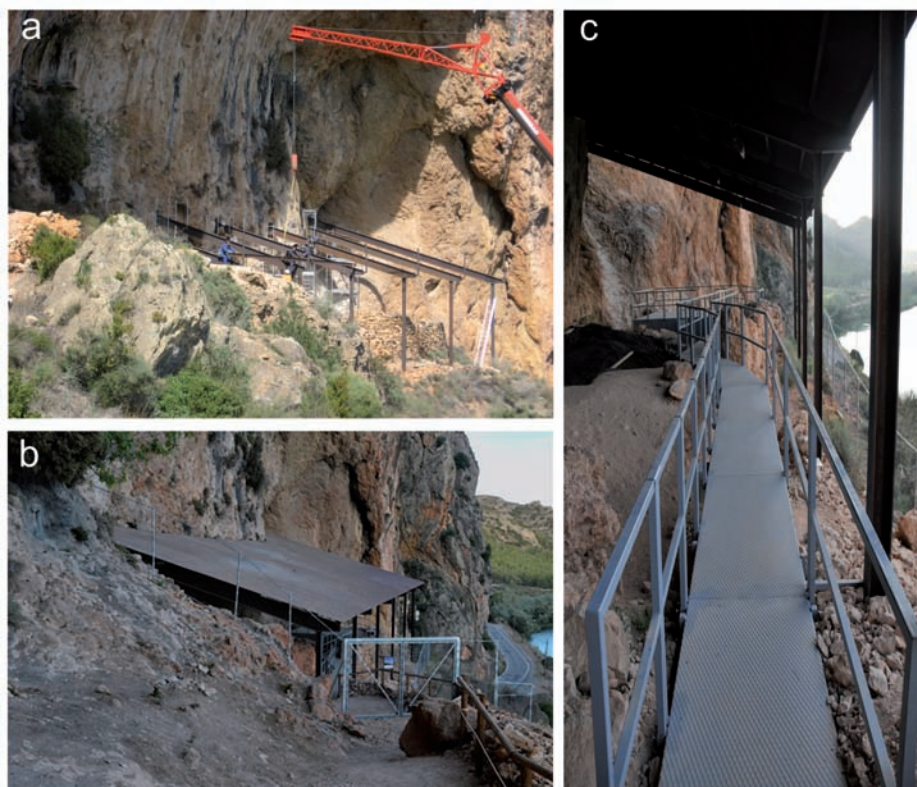
Figura 3. Adecuación y protección del yacimiento para el acceso público: a) obras de instalación de cobertura; b) aspecto del yacimiento tras la instalación de las infraestructuras de protección, y c) detalle de las pasarelas que facilitan la circulación del público a lo largo de la visita.

La protección del yacimiento y la creación de infraestructuras que hacen posible su visita han permitido adoptar un nuevo modelo, tanto de investigación como de divulgación científica, que se basa en el concepto work in process . Este planteamiento dinámico no solo pone el yacimiento al alcance de los visitantes, sino también la propia excavación. La instalación de pasarelas y rampas de acceso, así como la habi-