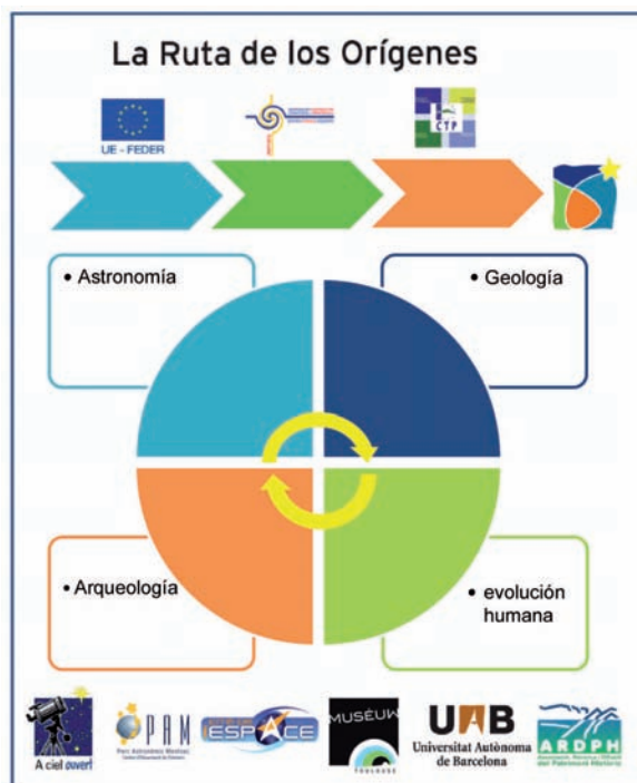
Figura 2. Participantes, organismos que han concedido la ayuda y ejes temáticos abordados dentro del proyecto Orígenes.

Dentro de las líneas prioritarias referidas a los orígenes históricos, el eje más destacado del proyecto se centra en la