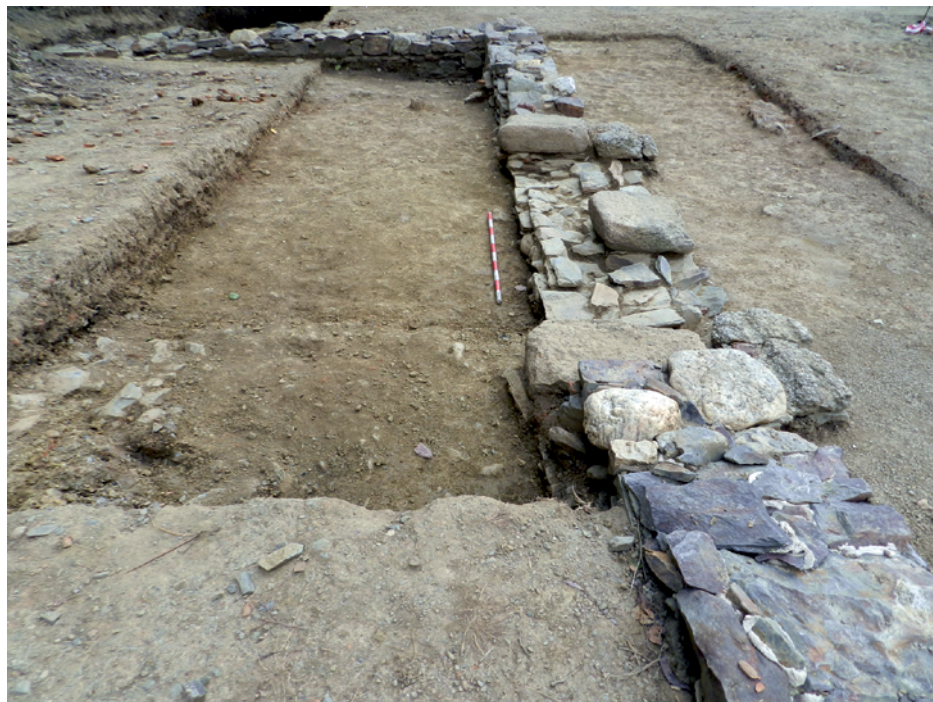
Figura 8. Imatge de la porta del complex.

En primer lloc es van haver d'enretirar les restes del nivell superficial de l'exterior del fòrum ubicades en aquest sector. Dins d'aquesta capa es va recuperar àmfora gal·la, itàlica (Dress 1 C, entre -125/-25 aC), tarraconense i bètica, ceràmica a mà reduïda, ceràmica ibèrica a torn reduïda i oxidada (olles globulars), emporitana tardana, sigil·lada itàlica (Consp 36, del segle I d.C. i Pucci 37, entre 1-50 dC), sigil·lada sudgal·lica, sigil·lada africana clara A i imitacions, parets fines, africana de cuina (Hayes 22, entre 70-150 dC, Hayes 182, entre 150-250 dC, i Hayes 197, entre 175-250 dC, ceràmica d'imitació d'africana de cuina, comuna romana i un fragment informe