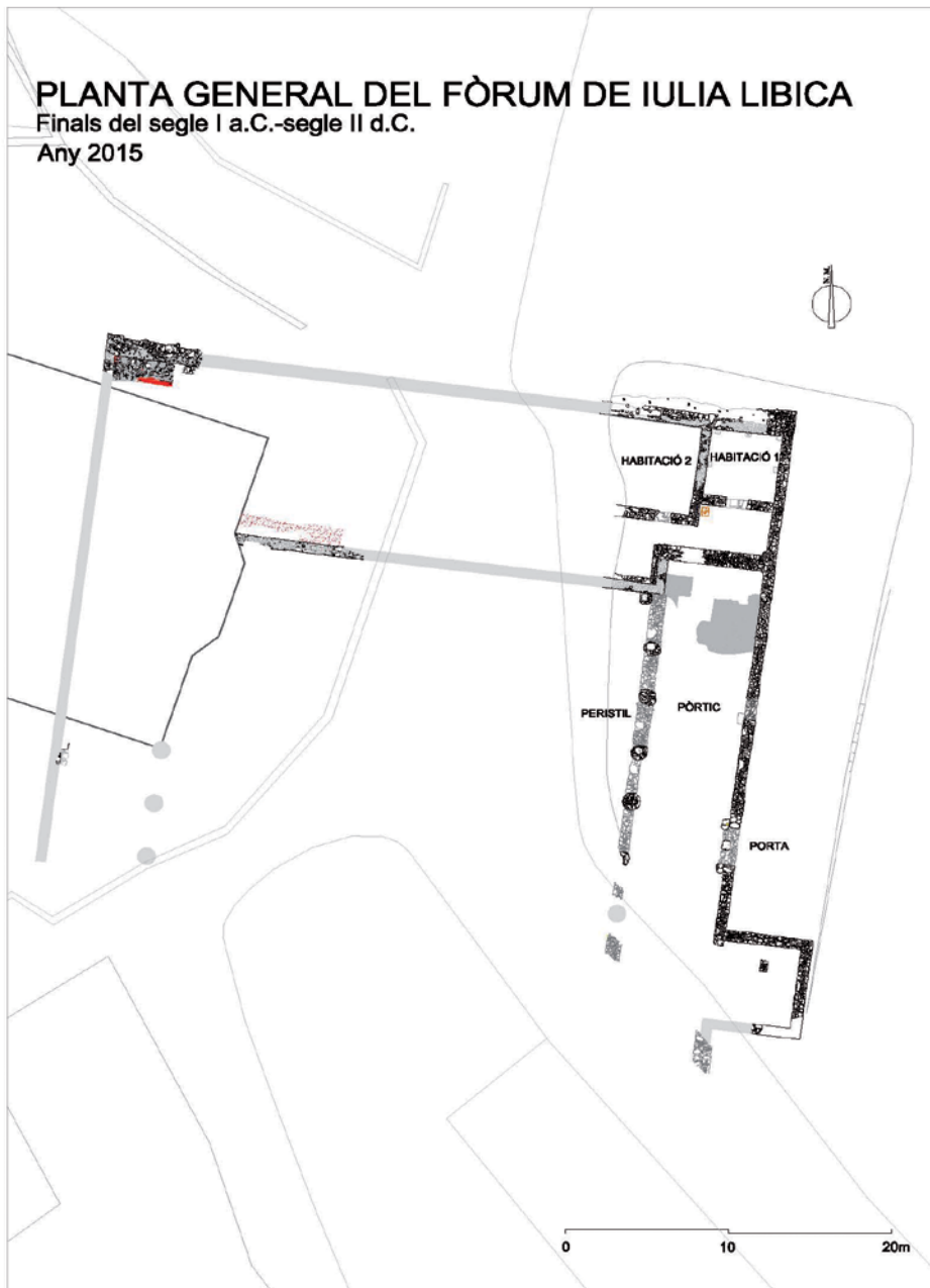
Figura 11. Planta general de les estructures documentades al fòrum de Iulia Libica . (Font: autors)