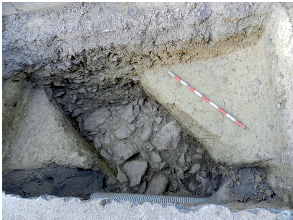
Figura 6. Imatge procedent de la cala 6.

una forma Drag 24/25 i diversos fragments de llàntia i ceràmica de parets fines. Tenint en compte la posició física dels murs i aquesta concentració de ceràmica, inusual a l'interior del fòrum, semblava que es confirmava que probablement ens trobem aquí fora del recinte principal, en un indret destinat a altres usos que devien tenir lloc a les fases 2 i 3 d'ocupació d'aquesta zona. A la cala 7 es va localitzar el tram final del mur 276 aparegut a la cala 6.