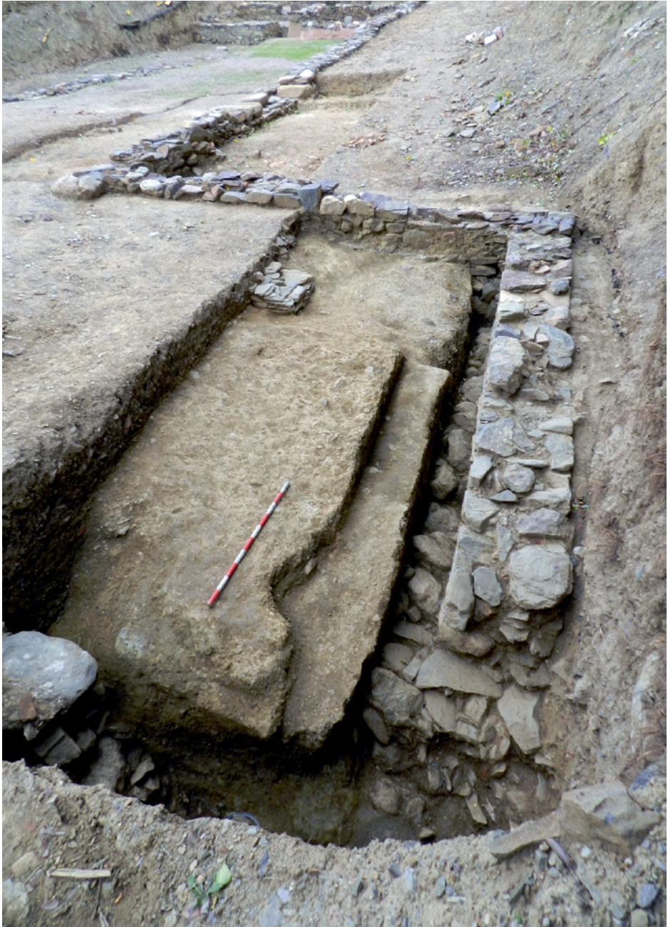
Figura 9. Exedra en el procés d'excavació.