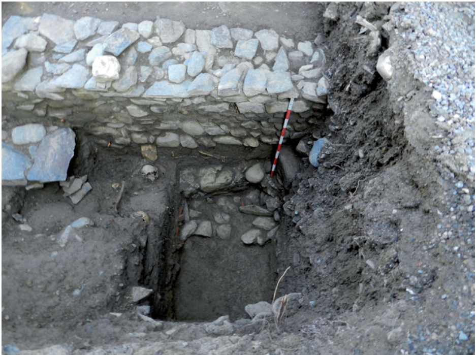
Figura 4. Imatge de la cala 3.

base (ue 263), mentre que el reompliment s'efectuà mitjançant blocs més petits i tegulae . Es dona la circumstància que aquesta rasa de fonamentació es trobava excavada en diversos estrats preexistents, que devien formar part d'una terrassa o nivell de reompliment, a l'inrevés del que succeeix amb la resta d'estructures importants de l'edifici, que també es fonamenten amb rases, però sempre excavades en el substrat natural. A l'interior de la rasa esmentada es recuperà material ceràmic divers, entre el que destaca un fragment de la vora d'un plat de ceràmica sigil·lada itàlica de la forma Ett 12.1 (-15/15). Es tracta del fragment més significatiu que s'ha trobat fins ara de cara a establir una possible cronologia pel moment de la