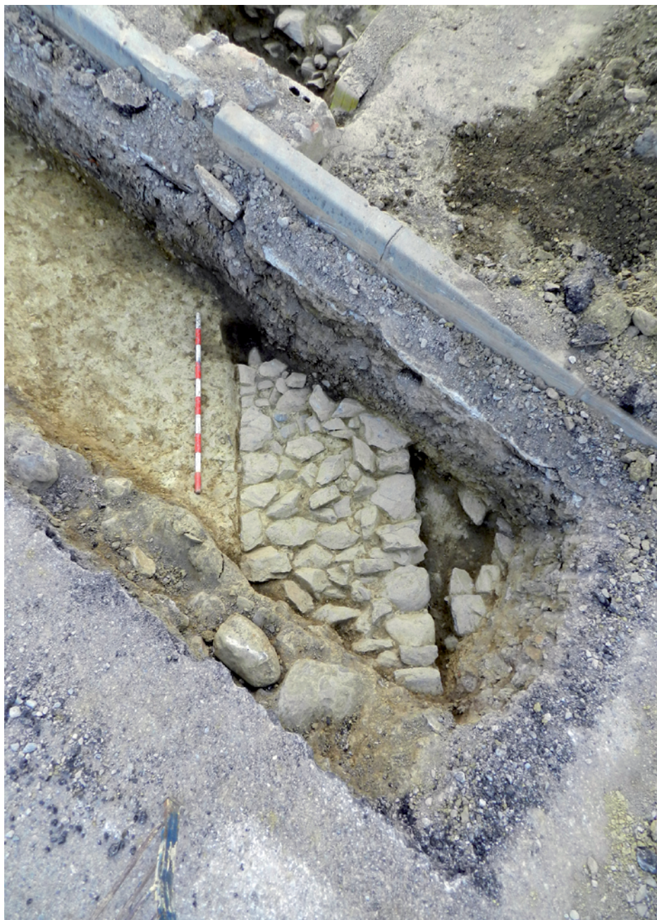
Figura 5. Detall de la cala 4.