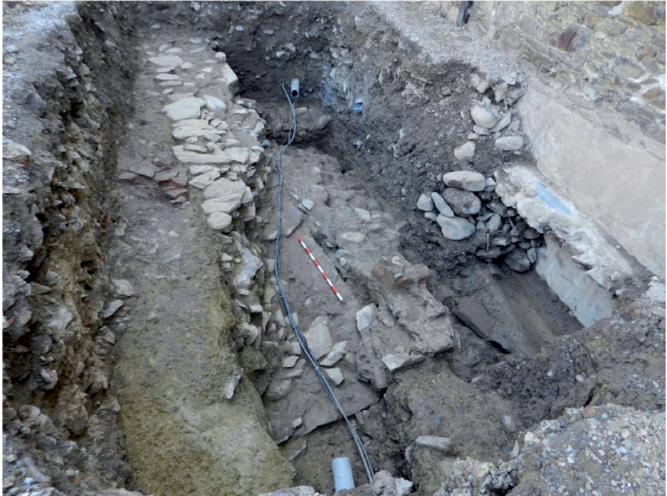
Figura 2. Imatge de la cala 1.

A 10,80 m de l'angle nord-est de l'edifici de l'església es va trobar efectivament la cantonada nord-occidental de l'edifici romà, lligada amb el mur 7, segons les proporcions de Ruscino . Un nou mur (ue 134) de 75 cm d'amplada, prenia la direcció meridional i semblava endinsar-se per sota de la façana de l'església, en el que era la confirmació de l'existència del mur perimetral occidental de l'edifici, i també l'evidència de la continuació lògica i regular de la seva planta general. Adossat a la cara interna de l'angle format pel mur septentrional de l'edifici i el mur 134 va sortir una altra cantonada formada per un mur de gran amplada (1,25 m), amb un aparell de blocs de pedra lligats amb morter de calç,