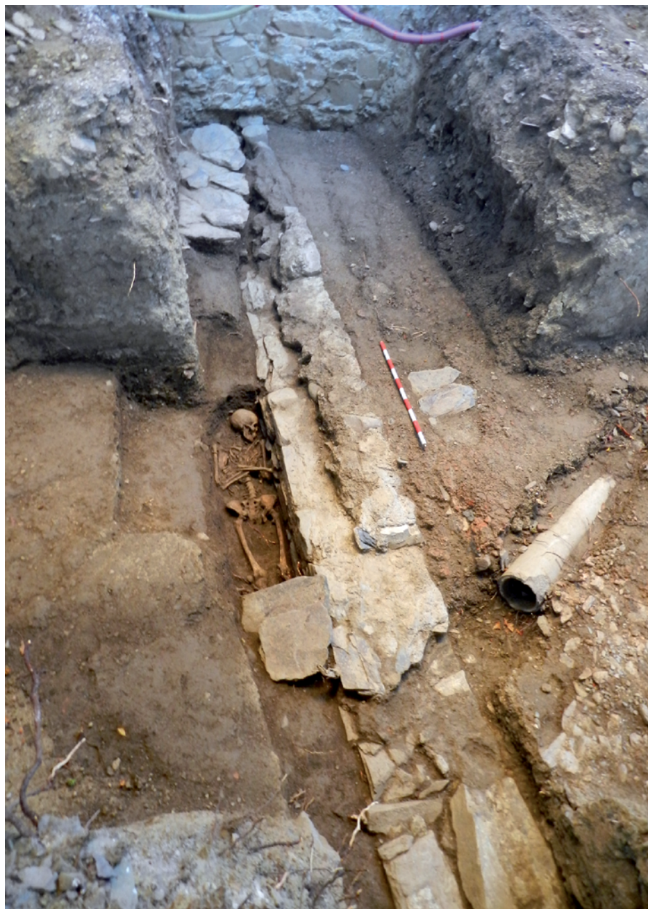
Figura 3. Imatge de la cala 2.