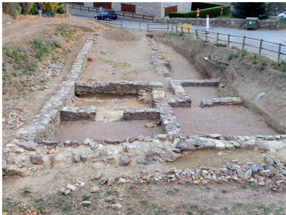
Figura 1. Vista general del jaciment de Les Colomines.

nença, calia destacar les similituds amb la cúria de Labitolosa (Magallón et alii , 2003: 343-353), el cas de Lugdunum Convenarum (Esmonde-Cleary, 2008), de gran similitud topogràfica amb Llívia i, sobretot, la idea arquitectònica i les dimensions del fòrum de Ruscino , datat en època d'August (Barruol i Marichal, 1987: 45-54), que era també el moment més probable de la construcció del probable espai públic de Llívia.