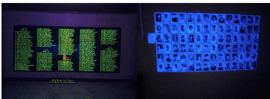
Imagem 6 e 7: Sala da Memória (interior): @Autor, 2022

Delante del lapidario, se expusieron las fotos de 167 paracaidistas muertos en acto de servicio en África, acompañadas de una inscripción funeraria 55 . Al nombrar a los