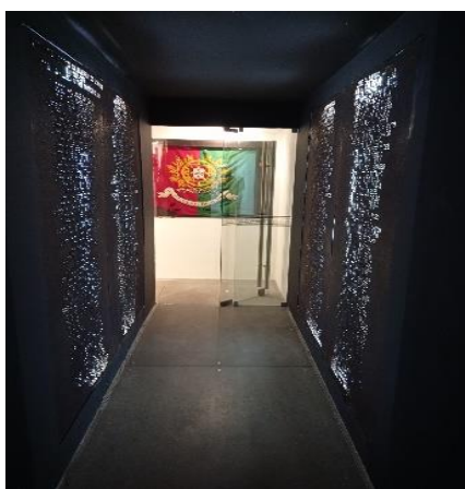
Imagem 5: MMA @Autor, 2022

Este «pasillo de la memoria» consiste en un pasillo flanqueado por paredes negras, donde se han grabado los nombres de los soldados azorianos muertos en la guerra (Imagen 5). Las letras son en realidad tachaduras en la chapa metálica que, al ser iluminadas por la luz blanca, permiten leer los nombres. Esto crea un efecto escénico