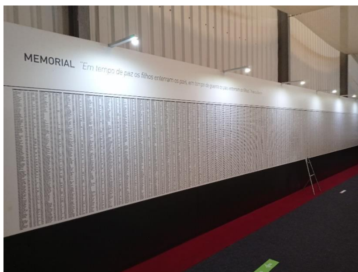
Imagen 4: Museo de la Guerra Colonial

La representación de los veteranos como héroes, pero también como víctimas, especialmente en el caso de los compañeros muertos en combate, evoca un discurso contemporáneo que resalta el sacrificio en la guerra y su trauma persistente 51 . Una práctica que potencia el proceso de heroización de los combatientes en los espacios museísticos es la colocación de lapidarios, donde se venera a los caídos en combate, y la construcción de memoriales que buscan inducir una experiencia sensorial de visita.