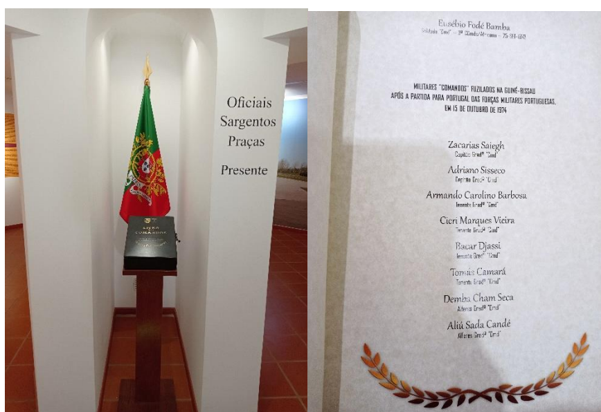
Imágenes 8 e 9: MAC, Oeiras

La Sala - Memória del Museo da Associação de Comandos (MAC) 56 es también un espacio de recogimiento. En un hueco de la sala se ha colocado un pequeño cofre-libro, flanqueada por una bandera militar nacional. A su lado, en la pared, está inscrito el grito de guerra - «Oficiais Sargentos Praças Presente» - que reivindica la solemnidad de ese «altar» (Imágenes 8 y 9). El libro es un tributo a todos los Comandos que murieron en servicio, enumerando sus nombres, rangos, fechas y lugares de fallecimiento. Además de los Comandos que «cayeron» en el transcurso del conflicto, el registro también incluye a los «COMANDOS MILITARES FUSILADOS EN GUINEA-BISSAU DESPUÉS DE LA PARTIDA A PORTUGAL DE LAS FUERZAS MILITARES PORTUGUESAS EL 15 DE OCTUBRE DE 1974» 57 .