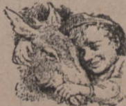
CAIRE D' ALBUM