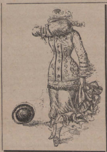
Alegoría del vent.