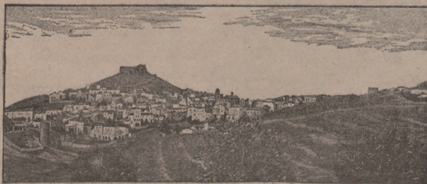
Bagur (Girona.)—Vista general.