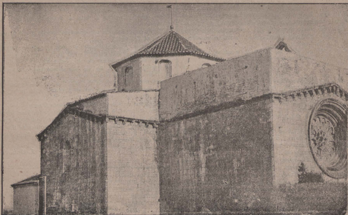
PLA DE CABRA (Tarragona).—Iglesia.