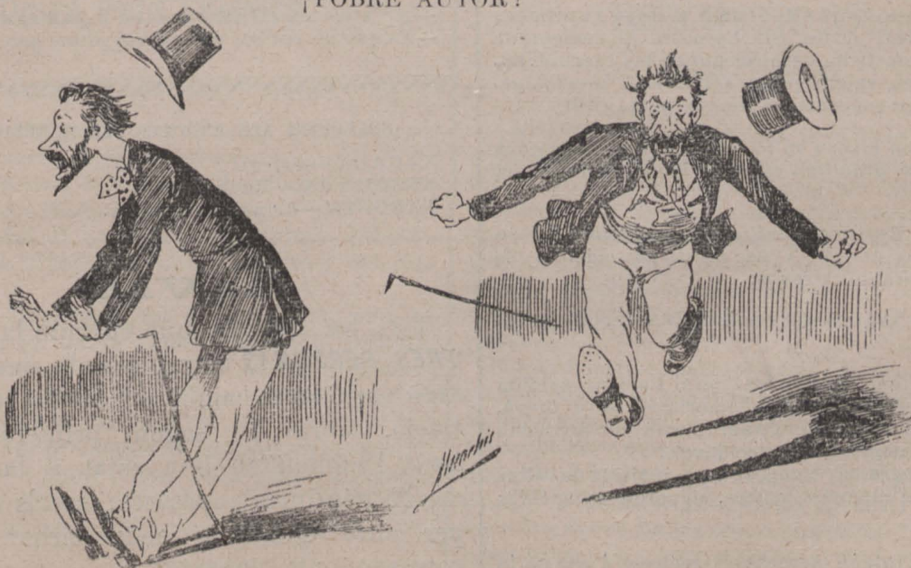
Efectes d' un mal éxit.